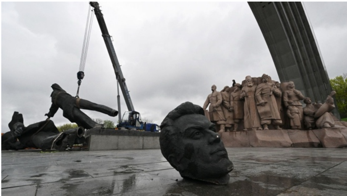
Avril 2023. Kiev démolit un monument historique dédié à l'amitié russo-ukrainienne.

Le 24 février 2022, la tentative d'invasion de l'Ukraine par l'armée russe a ramené la guerre au cœur du continent européen, faisant renouer la Russie avec ses vieux démons impériaux. Cette guerre interroge à la fois la construction historique du concept de « plus grand pays du monde », mais aussi la place de la Russie dans l'ordre international.